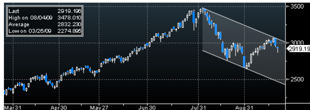
BORSA DI SHANGHAI

14.30 International Securities Transactions (Canadian dollars) (JUL) -- 10.511B 16.00 USA Leading Indicators (AUG) 0.7% 0.6% 23.30 New York Fed's Christine Cumming Speaks on Economic Recovery -- --